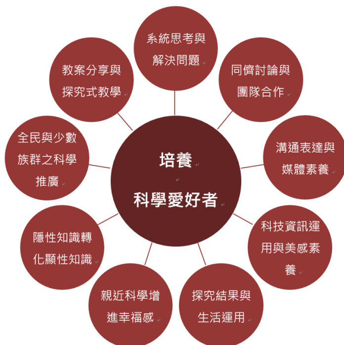
圖 1、全國科學探究競賽核心價值

本競賽的核心目的為「 培養科學的愛好者 」，藉由競賽讓同儕間進行討論與團隊合作，從討論間系統思考與解決問題，將隱性知識轉化成顯性知識，系統化的將研究結果記錄在影音及文字中，培養科技資訊運用與媒體溝通表達的素養，最終能夠將探究結果運用在生活周遭中。對於女性、新二代及原住民的作品都有適當加分，以鼓勵他們發揮科學探究精神。對於優秀作品本計畫也期待能夠加值其價值，例如出版刊物或親自演示，如此完整構成本競賽的核心價值的圖，如下圖 1 所示。