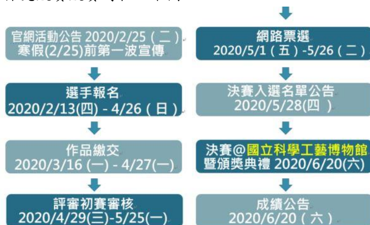
圖 2、2020 全國科學探究競賽競賽時程