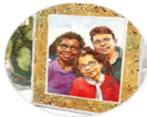
Family & Friends