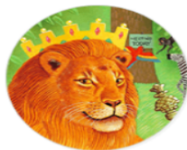
Animals & Plants