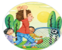
Sports & Outdoors