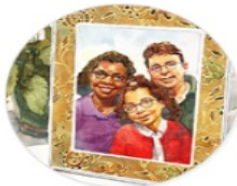
Family & Friends