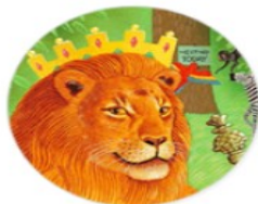
Animals & Plants