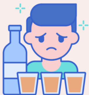
拒絕菸酒與危害精 神毒品