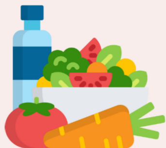
均衡飲食 三餐定時定量