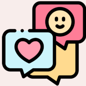
與同學的閒聊過程