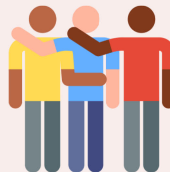
建立良好的人際關係