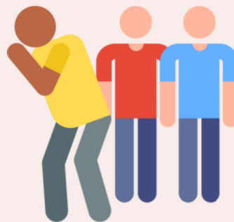
關係霸凌 (孤立他人)