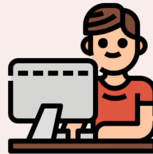
從同學的臉書或社群平台上的訊息