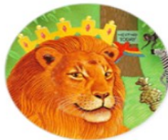
Animals & Plants