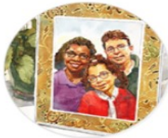
Family & Friends