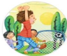
Sports & Outdoors